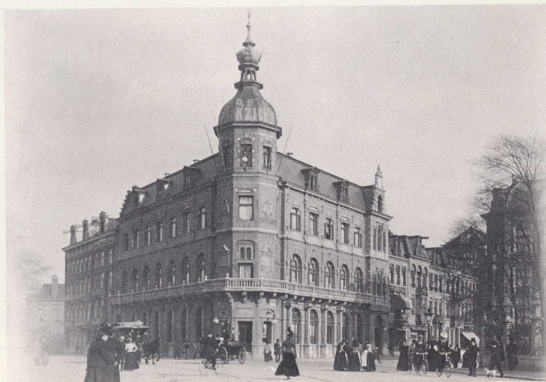
Dezelfde hoek, nu met het nieuwe Parkzicht uit 1895-96, van wat grotere afstand gefotografeerd