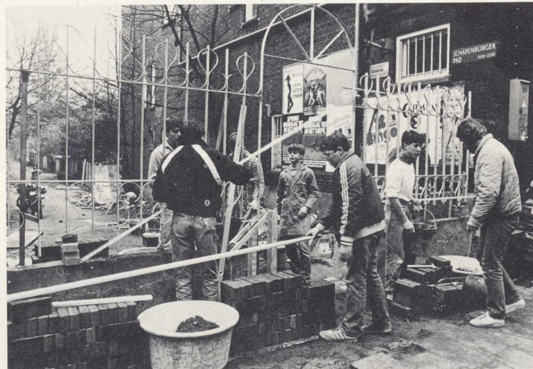
Het hek in uitvoering, december 1982

In het najaar van 1982 wordt koortsachtig gewerkt aan de uitvoering van de genomen besluiten. Op initiatief van Commissaris Schaefer wordt de Vereniging Amsterdamse Bouwbedrijven bereid gevonden de werken zoveel mogelijk belangeloos te doen uitvoeren. Zijn plan om het hek c.a. als 'leerlingenproject' te doen uitvoeren door de Technische School Concordia Inter Nos wordt enthousiast ontvangen. Men kan