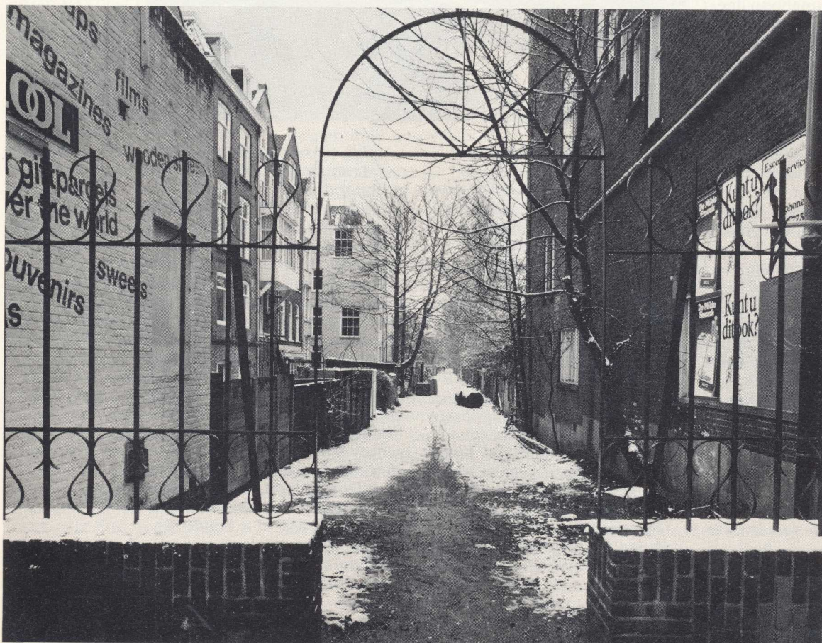
Het Schapenburgerpad achter het hek, 9 februari 1983 (Foto Bert Brand, Dienst Ruimtelijke Ordening)

(Afbeldingen uit Atlas Gemeentelijke Archiefdienst, tenzij anders vermeld)