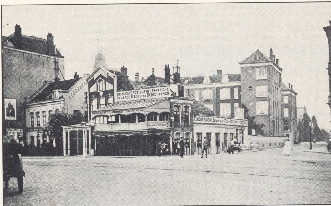
Stadhouderskade hoek Hobbemastraat omstreeks 1894, kort voor de afbraak van het oude en de bouw van het nieuwe café-restaurant Parkzicht. De tramrails volgen de Stadhouderskade